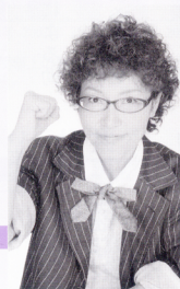
NPO法人HOPE プロジェクト理事長

1940年生まれ、Breast Cancer Network Japan あけぼの会会長。会のモットー「再び、誇り高く美しく」