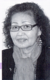
乳がん患者会 「あけぼの会」会長