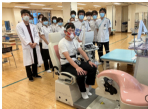
知識・技術向上のための担当スタッフで勉強会を実施