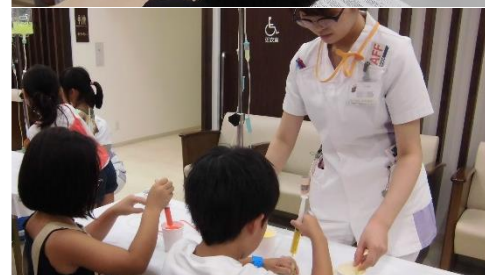
紀和カーニバルの様子